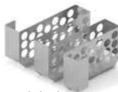
Optional: Divisorio buste sottovuoto Vacuum bags dividing