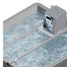
Optional: Divisorio buste sottovuoto Vacuum bags dividing