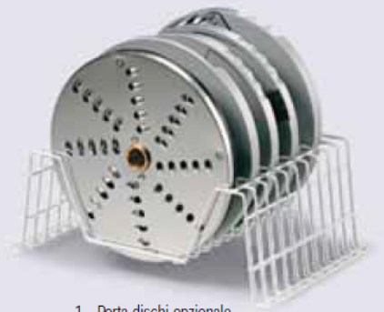
1 - Porta dischi opzionale Discs holder optional